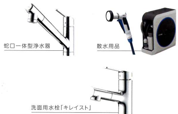
蛇口一体型浄水器